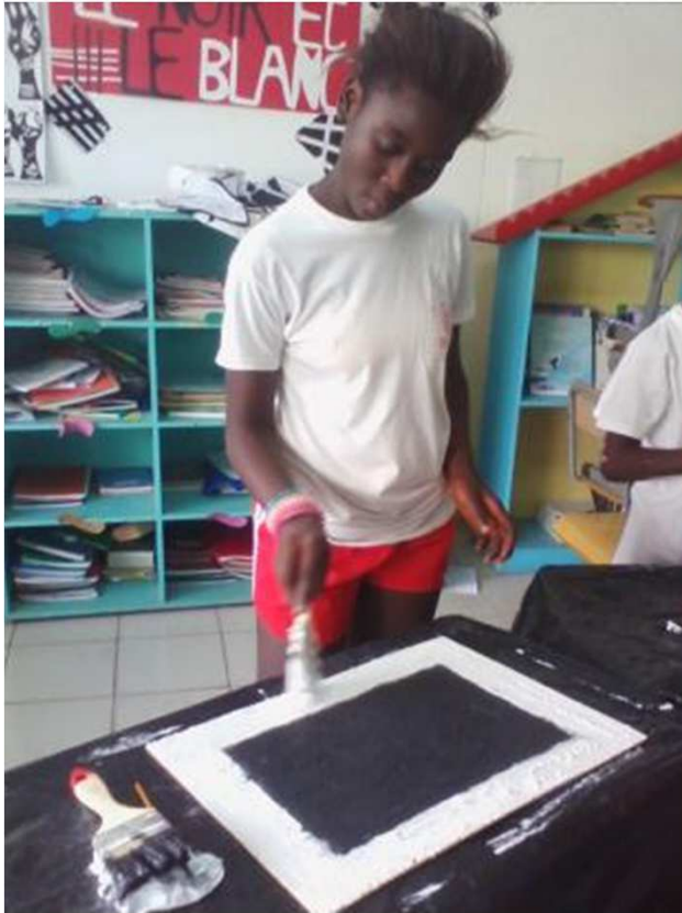
A la façon de Kasimir Malevich