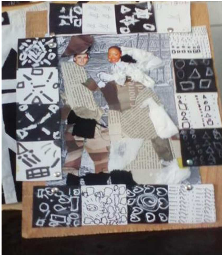
Graphismes sur morceaux de papier noir et blanc