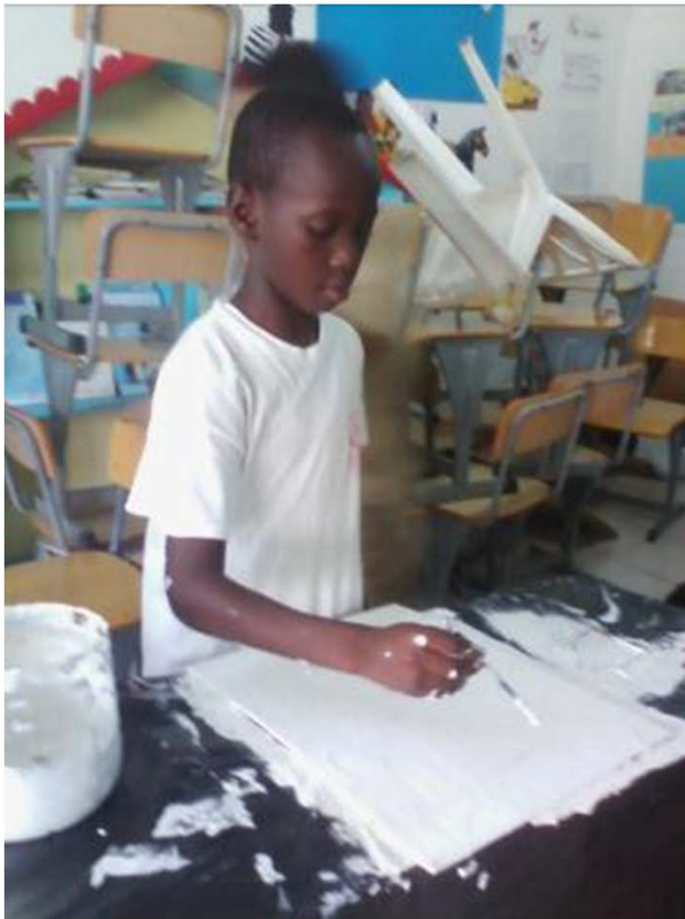
Peinture monochrome sur planche de bois