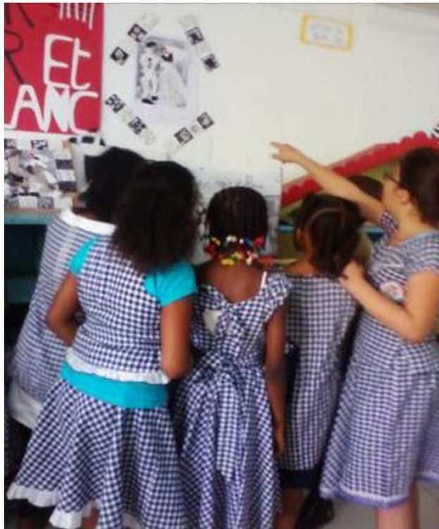
Des élèves du CM2 à l'exposition