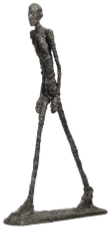
« L'homme qui marche » d'Alberto Giacometti.

L'amitié sert à échanger, à se faire confiance, à partager mais il faut faire attention car les amis peuvent devenir tes ennemis et tes ennemis tes amis !