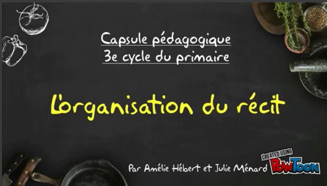
Schéma du récit

Vidéos explicatives à retrouver dans le dossier « Jour 2 »