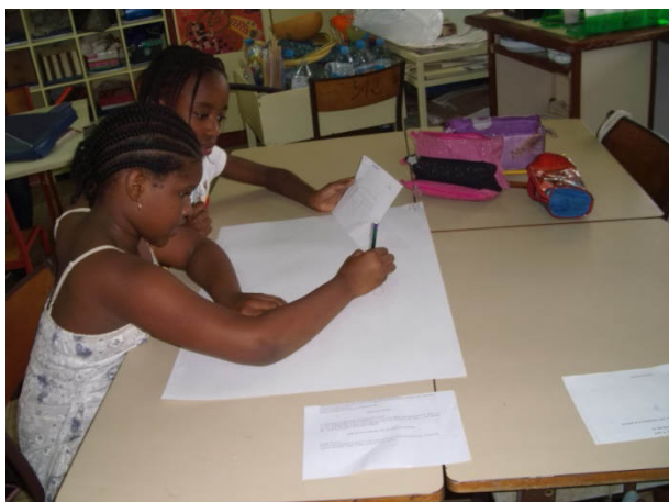
Séance 3 : Mise en place des dispositifs par groupe.