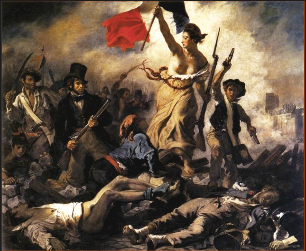
La liberté guidant le peuple (1831)