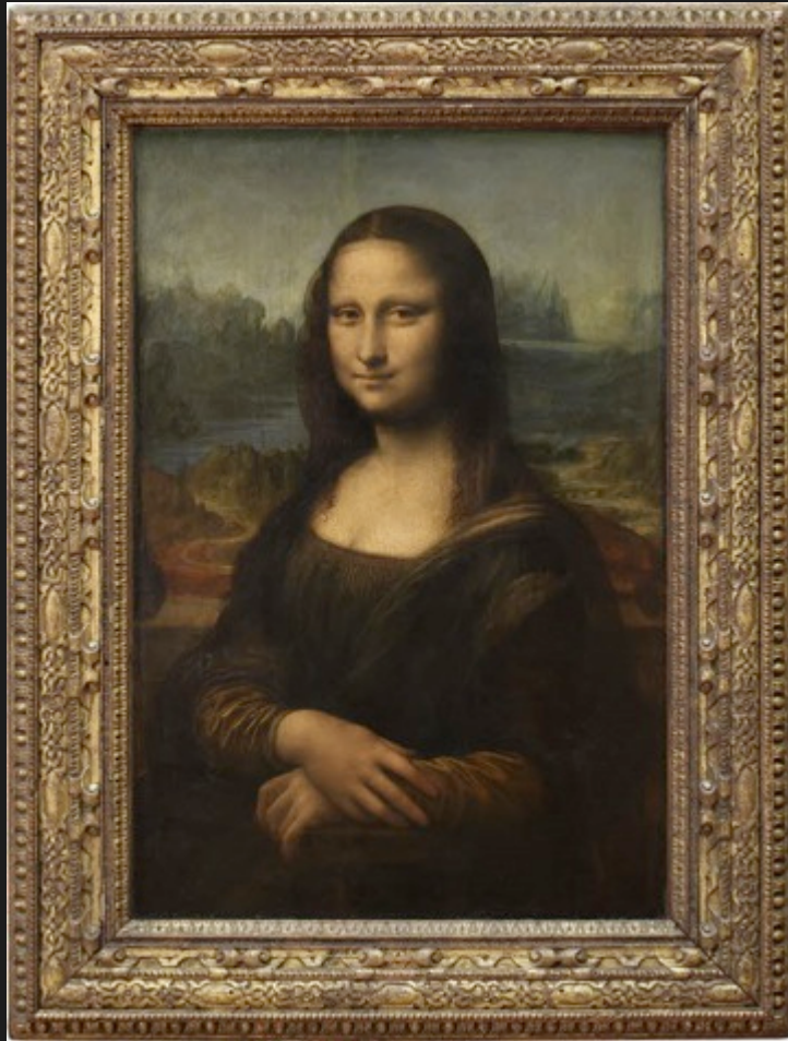
LEONARD DE VINCI La Joconde 1503-1506 Huile sur bois, 77X 53cm