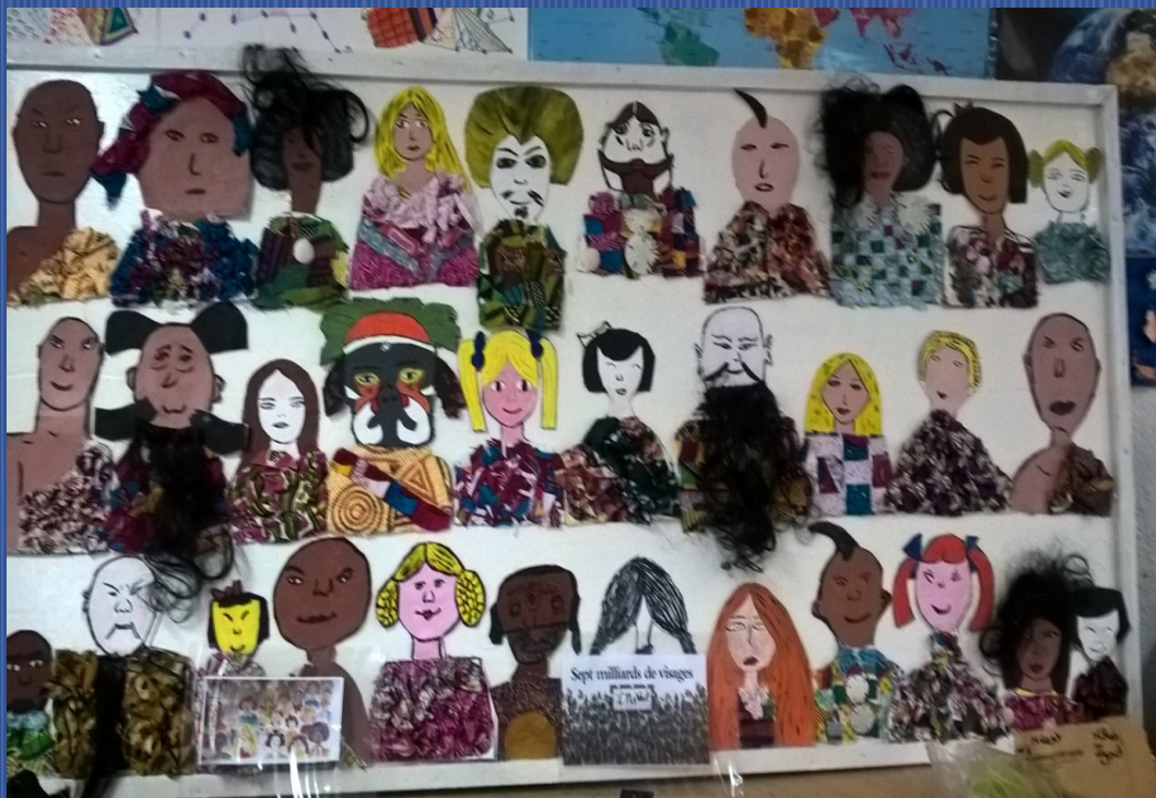
Sept milliards de visages