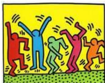
La vie est une fête , Keith HARING