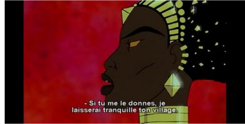
Gros plan (visage, profil gauche)