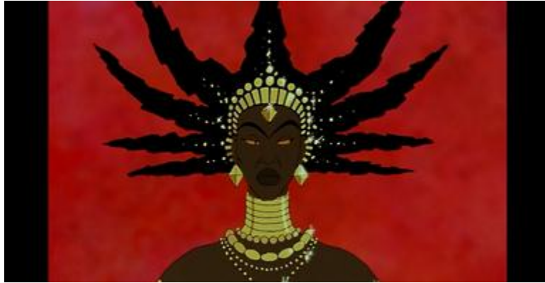
Plan en buste