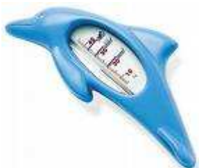
Thermomètre de bain