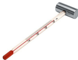
Thermomètre à vin