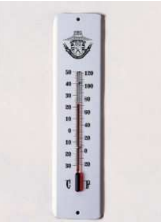
Thermomètre de jardin