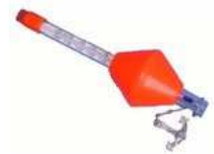
Thermomètre de piscine